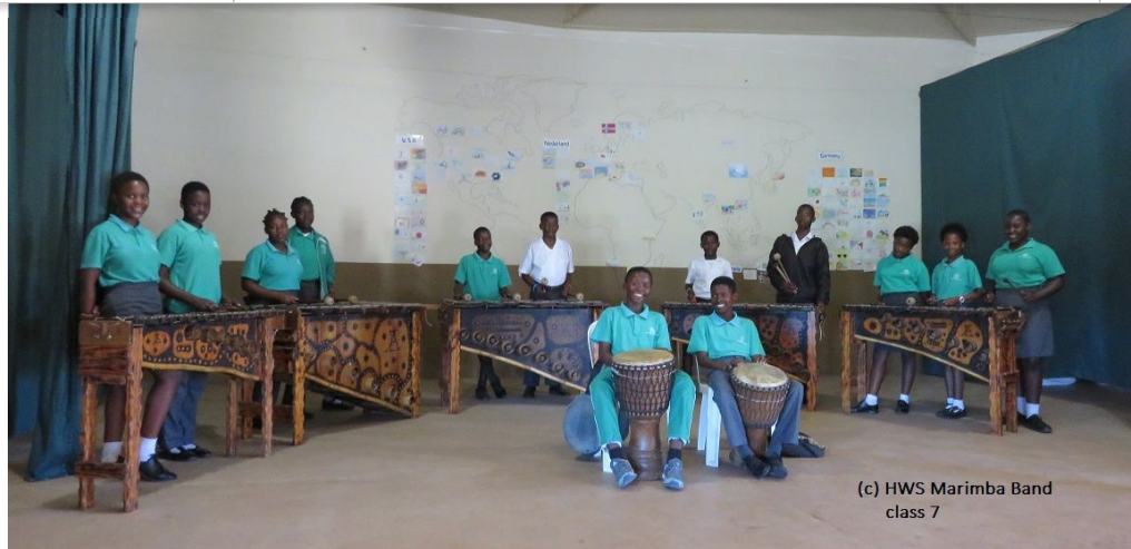
(c) HWS Marimba Band class 7