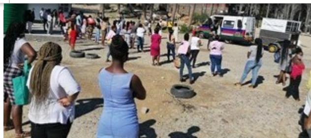
Voorlichting over Covid-19